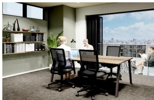
▲ レンタルオフィス（4名用）※イメージ