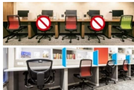
感染症対策 イメージ