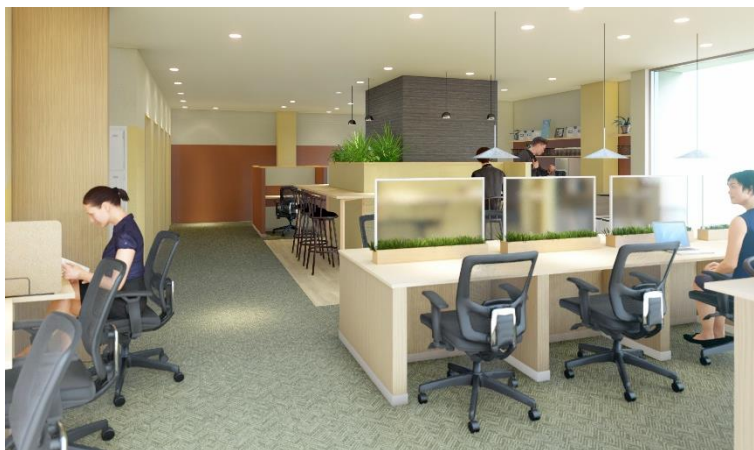
BIZcomfort 八千代緑が丘 イメージ

※新型コロナウイルス感染症(COVID-19)の影響によりオープン日などが変更となる可能性があります。