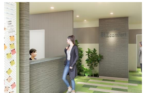
エントランス・受付 イメージ

当施設は 24 時間 365 日利用できます。ライフスタイルに合わせていつでも使えるため、フレックスタイム制のはたらき方にも便利。テレワークの他、資格取得のための勉強や副業などにも活用できます。平日はコンシェルジュもいるので、来客対応や荷物の受取・転送サービスも承ります。