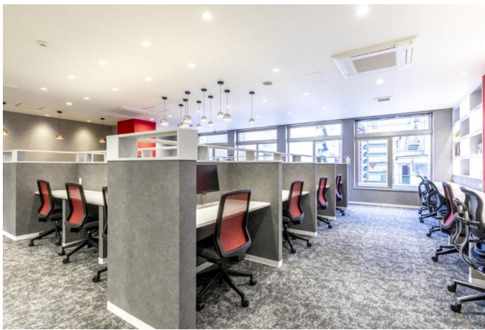
▲ BIZcomfort 大阪東梅田