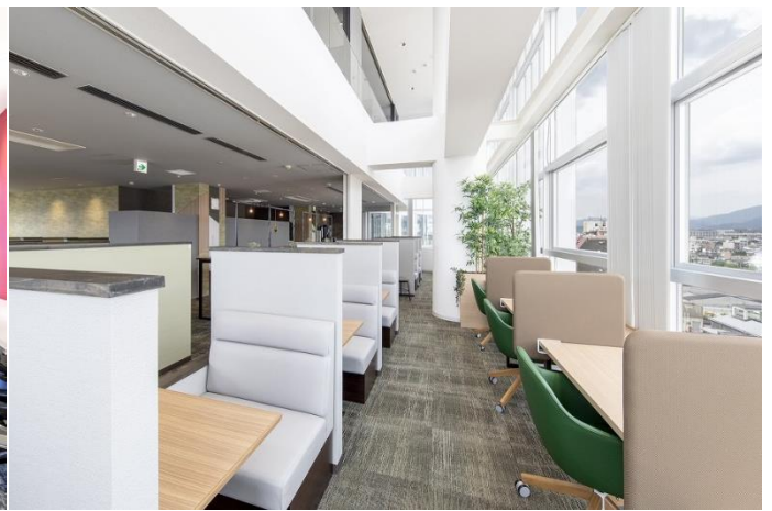
▲ BIZcomfort 三条木屋町