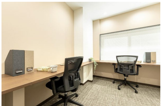
2 名用レンタルオフィス イメージ