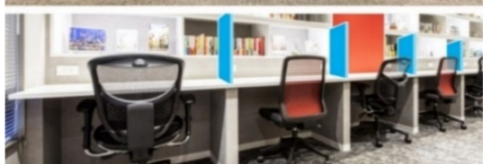
感染症対策 イメージ