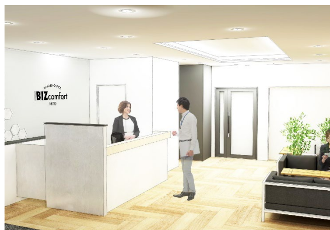
BIZcomfort 水戸 エントランスイメージ

茨城県水戸市は「水戸市中心市街地活性化基本計画」のもと、水戸市の中心市街地を活性化することで、コンパクトな都市機能を目指し、『多様な人々が集い、暮らし、働き、皆が魅力を味わえる、快適でにぎわいのある水戸のまちなか』という将来像を掲げています。※1