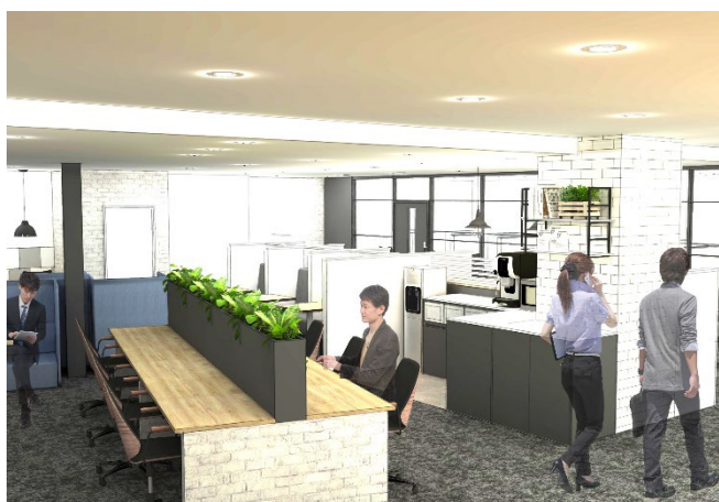
BIZcomfort 水戸 カフェースイメージ

※新型コロナウイルス感染症(COVID-19)の影響によりオープン日が変更となる可能性があります。