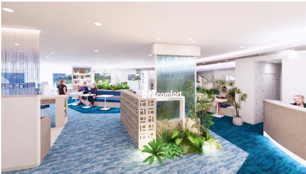
カフェブース イメージ