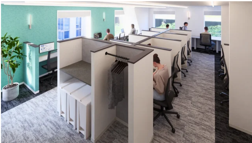
ワークブース イメージ

「BIZcomfort月島」は、TIDE（タイド）＝“潮の満ち引き”をテーマに、利用者の皆様が思考を整え、物事を良い方向へと動かす「好機」を掴める空間づくりを目指しています。集中して作業に没頭できるワークブースを完備し、フリーランスや個人事業主、さらなる飛躍を目指すビジネスパーソンが次なるチャンスを掴むための環境を整えました。ここ月島の地から、新たな時代の潮流を生み出す拠点として、皆様の挑戦をサポートします。