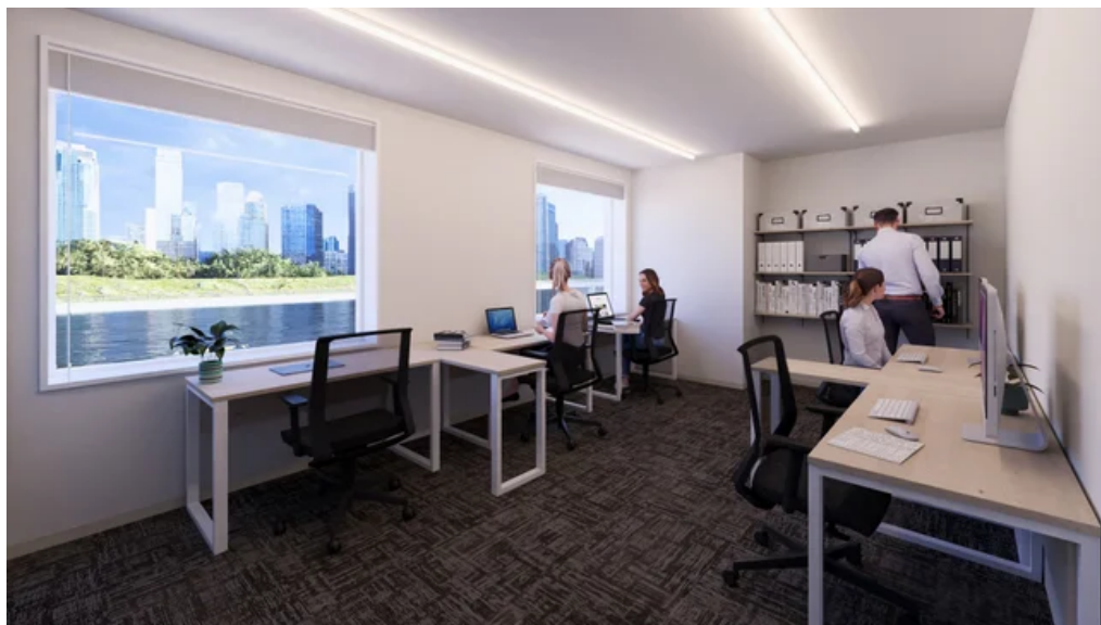
5名用 レンタルオフィス イメージ

※2 別途契約金が必要になります。また、お部屋の大きさによっては、保証金や保証会社のご利用をお願いする場合がございますので、詳細はお問い合わせください。